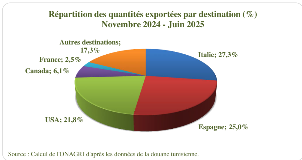
Exportations de l'huile d'olive biologique tunisienne (Novembre 2024-Juin 2025)